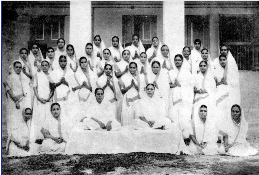
पूज्य बहिन श्री बहिन की चरण छाया में ब्रह्मचारिणी बहिनों का समूह