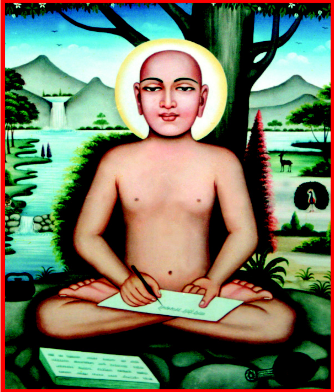
ભરતક્ષેત્રના મહાસમર્થ આચાર્ય ભગવાન શ્રી કુંદકુંદાચાર્યદેવ