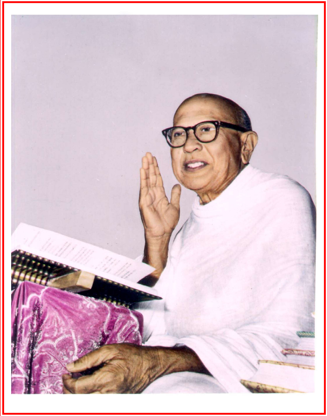
અધ્યાત્મયુગસર્જક પૂજ્ય ગુરુદેવશ્રી કાનજીસ્વામી