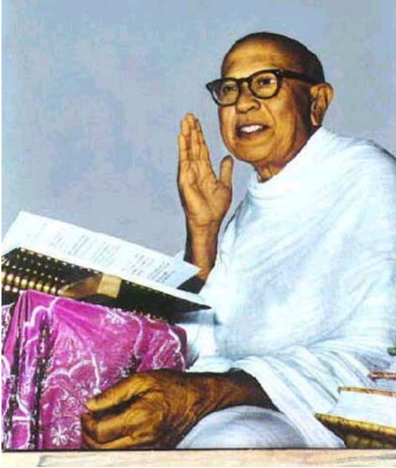
परम पूज्य आत्मज्ञसंत श्री कानजिस्वामी