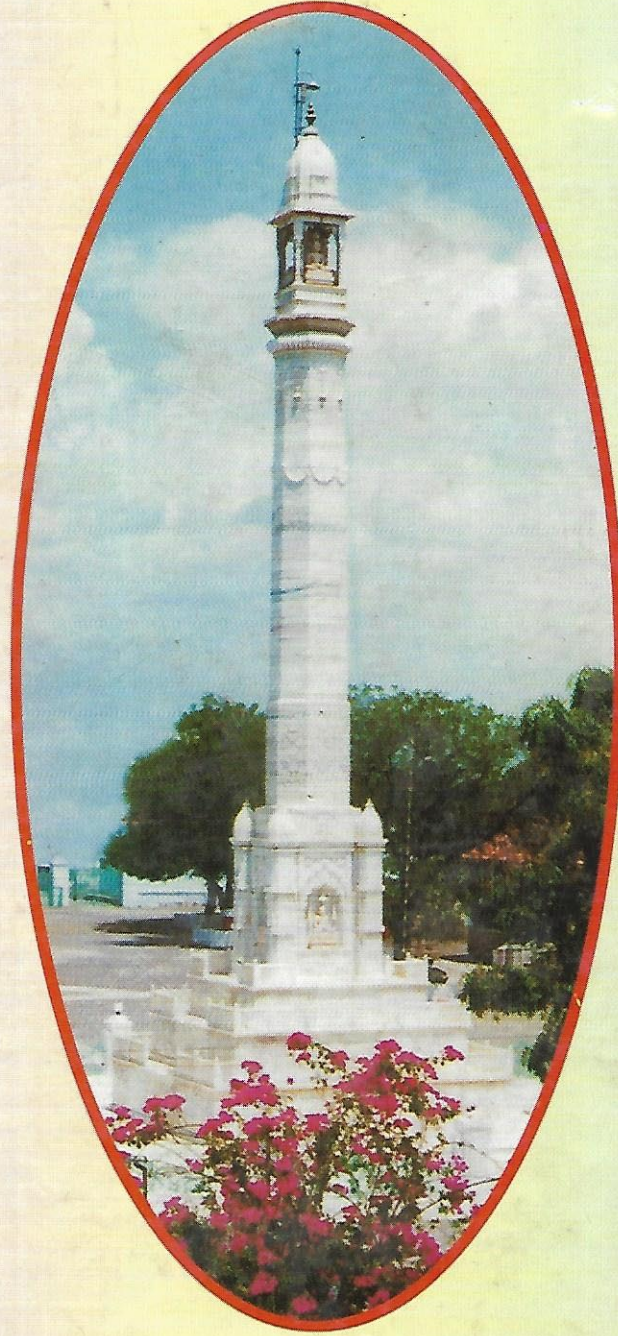
मानस्थंभञ्ज सुवर्णपुरी, सोनगढ