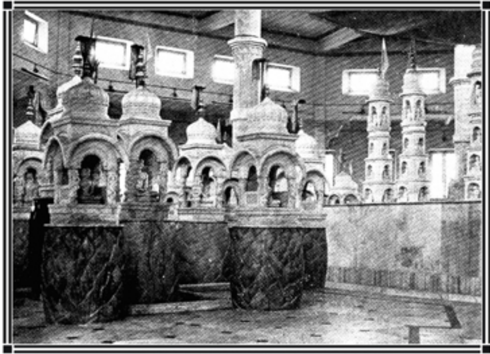
સમ્મેદશિખર-મધુવન : તેરાપંથી કોઠીમાં નંદીશ્વર જિનાલય

“તીર્થ” નો ઘણો મહિમા છે. આ ભવસમુદ્ર જેનાથી તરાય તેને “તીર્થ” કહેવાય છે. સમ્યક્દર્શન-જ્ઞાન-ચારિત્ર વડે સંસારથી તરાય છે. તેથી તે રત્નત્રય એ ખરૂં તીર્થ છે અને એવા રત્નત્રયધારક સંતો-મુનિઓ-તીર્થકરો જ્યાં વિચર્યા હોય તે ભૂમિ પણ તીર્થ છે. આવા તીર્થની યાત્રા કરતા તે આરાધક જીવોનું સ્મરણ થાય છે અને આપણને પણ એવી આત્મસાધના કરવાની પ્રેરણા જાગે છે.