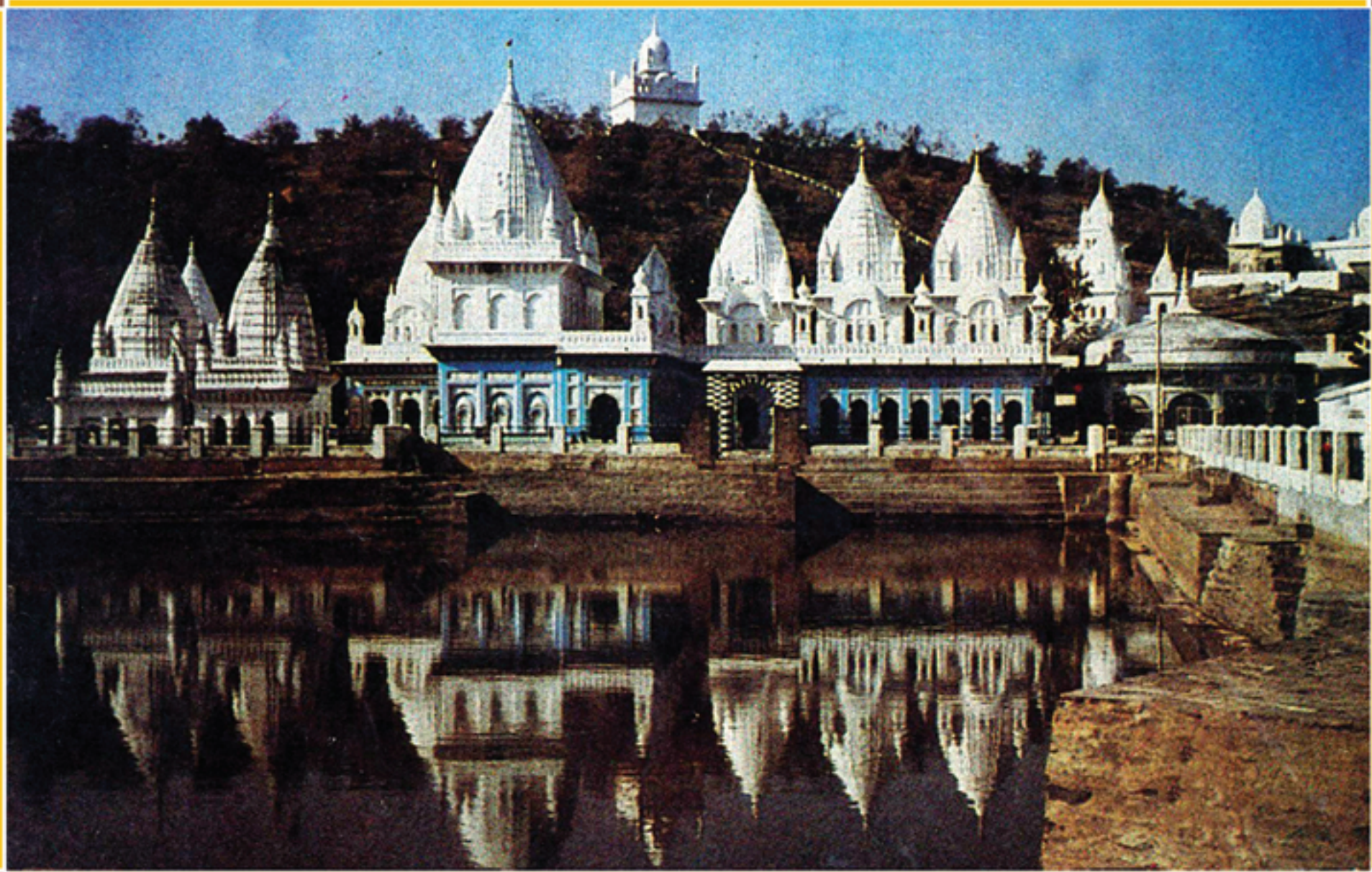
सिद्धक्षेत्र कुंडलपुर-धमोड - मध्य प्रदेशनुं अेक विहंगम द्रश्य