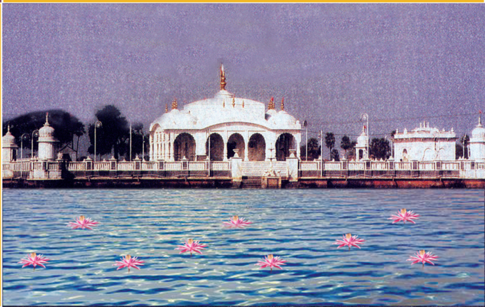
श्री दिगंबर जैन सिद्धक्षेत्र, जलमंदिर, पावापुरी, जि. नालंदा - बिहार