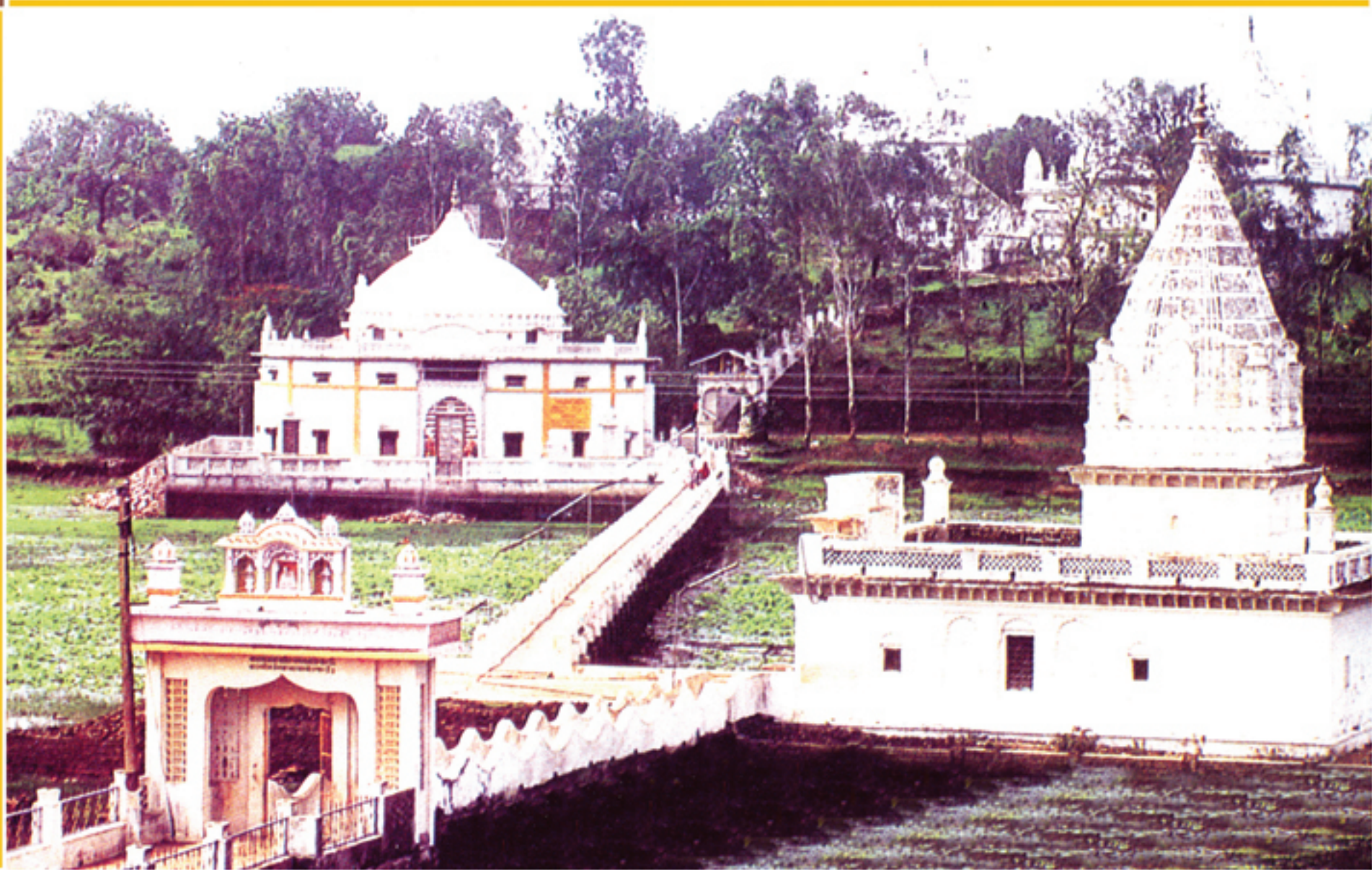
तीर्थक्षेत्र श्री नैनागिरी स्थित जलमंदिर