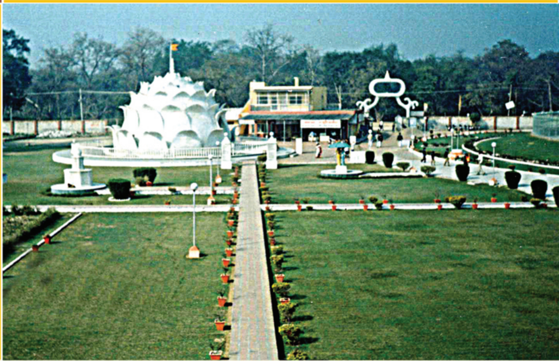
श्री द्विगंबर जैन कमल मंदिर, हस्तिनापुर - उत्तर प्रदेश