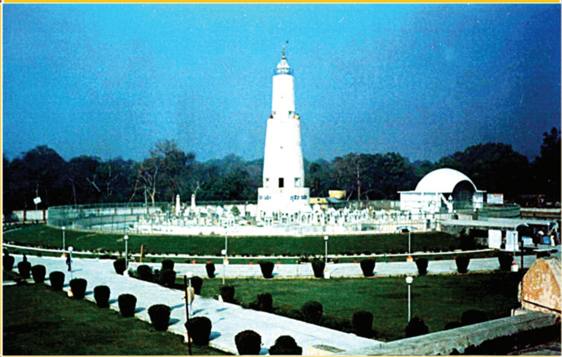
श्री सुमेरु पर्वत अने जम्बु द्वीपनी रचना, हस्तिनापुर - उत्तर प्रदेश