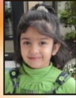
बची पिकेब बोटादरा घाटकोपर, मुंबई

आदि प्रभु ऋषभ ने किया, अनोखा काम। जन्म मरण का अंत कर, ऋषभ बनो भगवान।