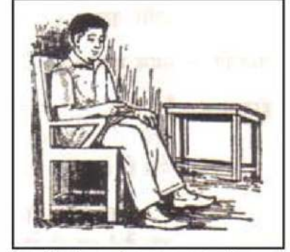
ये (टेबल और शरीर) अजीव हैं।