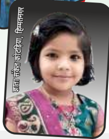
डाबा सैबिन कोटडिया, सिमागावर