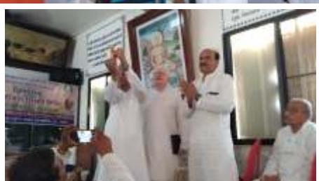
कार्यक्रमों की झलकियाँ