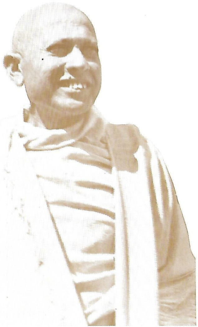
પરમ પૂજ્ય સદ્ગુરુદેવ શ્રી કાનગુસ્વામી