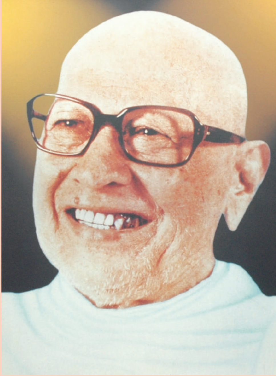
अध्यात्मयुगसृष्टा पूज्य गुरुदेवश्री कानजीस्वामी