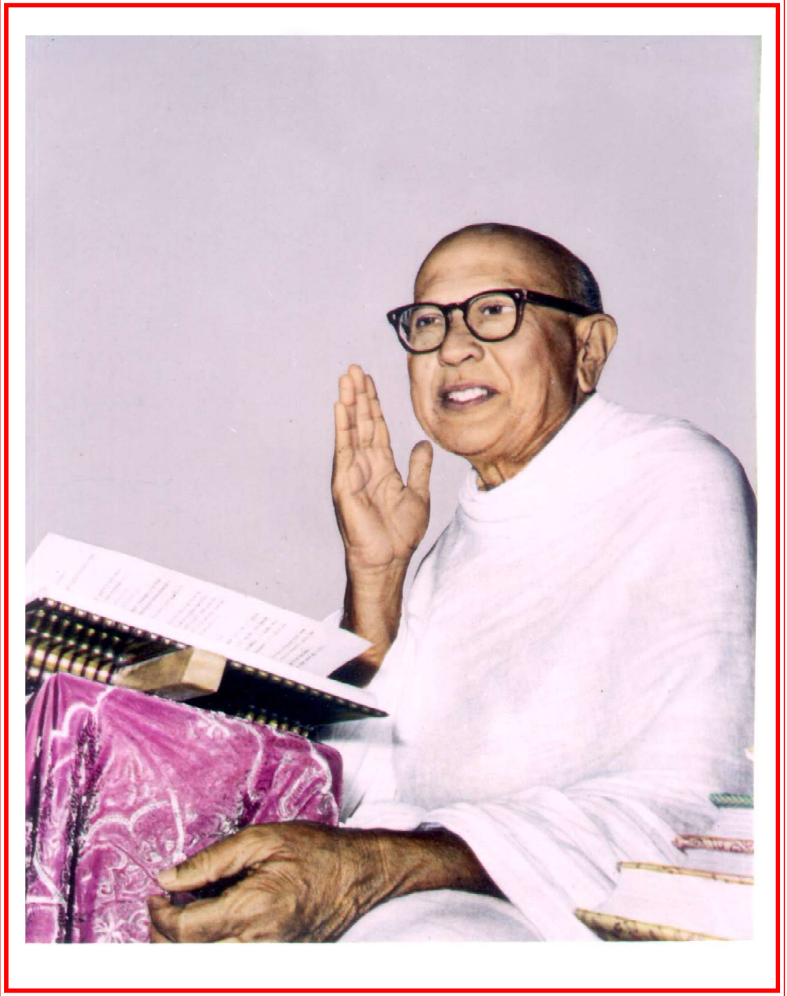
અધ્યાત્મયુગસર્જક પૂજ્ય ગુરુદેવશ્રી કાનજીસ્વામી