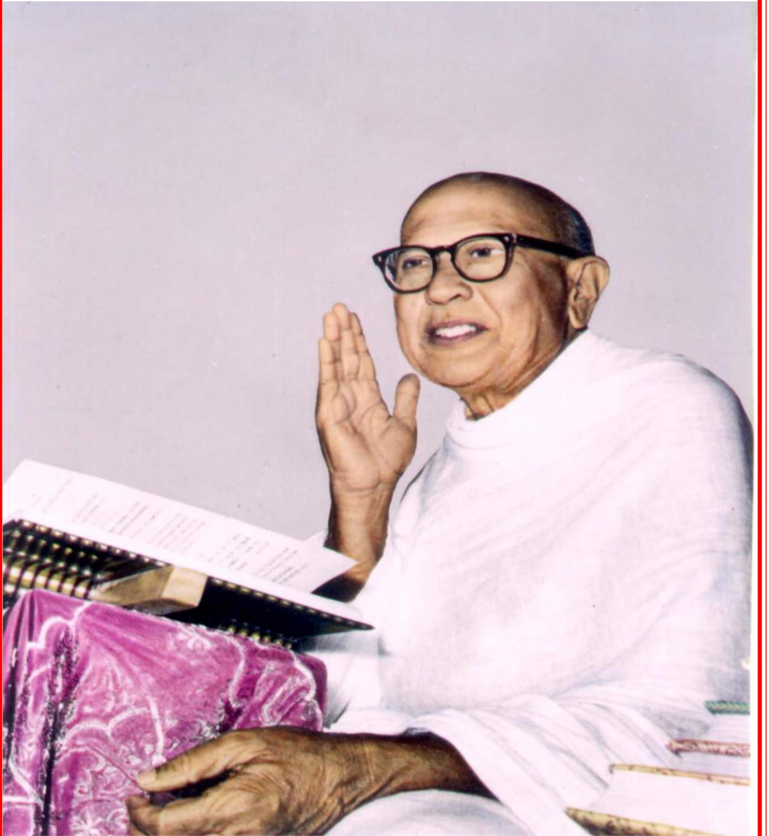
अध्यात्मयुगसर्जक पूज्य गुरुदेवश्री कानछस्वामी