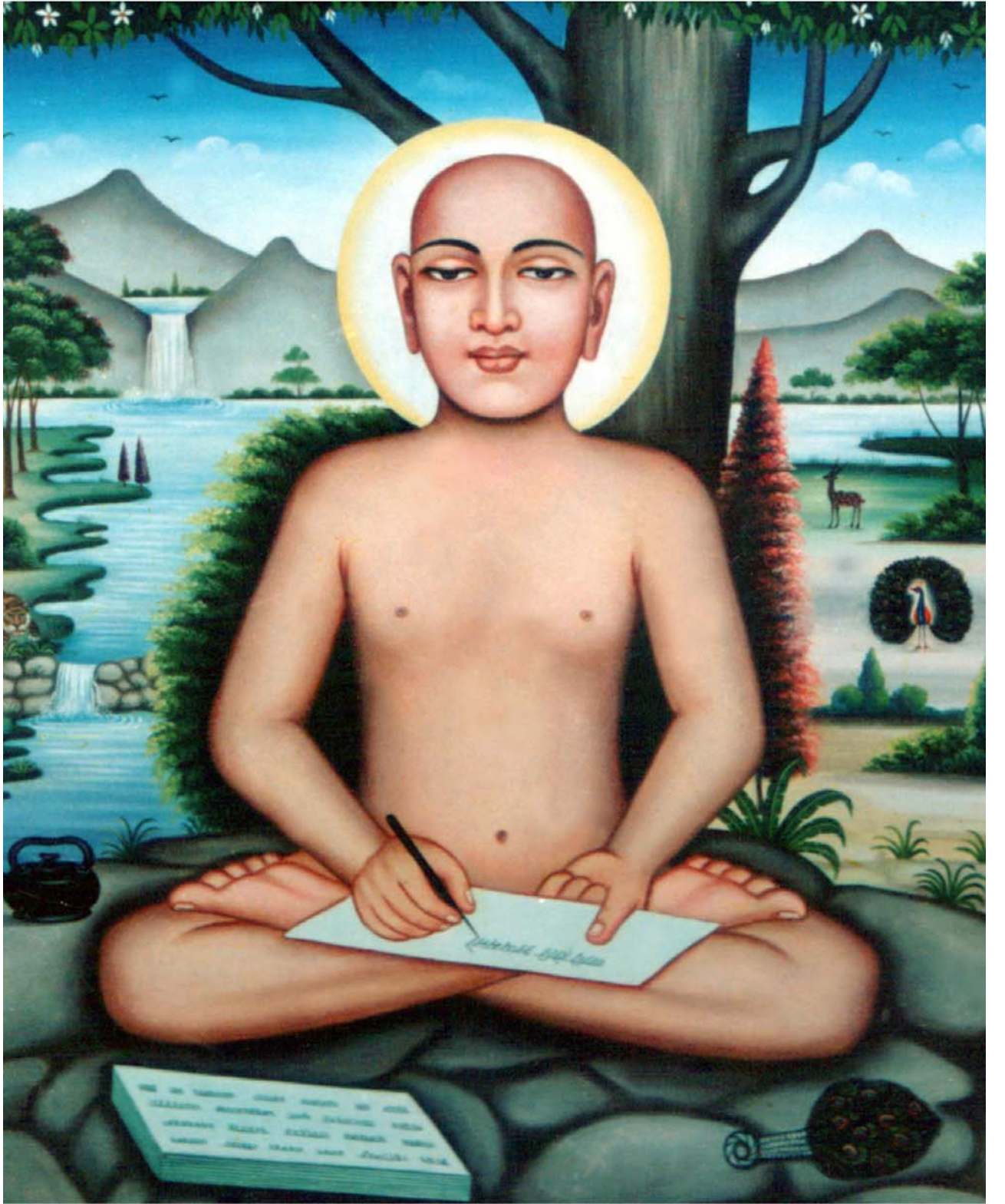
भरतक्षेत्रके महारामर्थ आचार्य श्री कुंदकुंदाचार्य देव