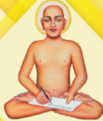
श्री कुंडकुंड आचार्य देव