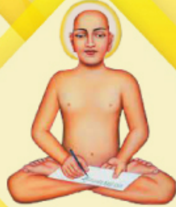
श्री कुंडकुंड आचार्य देव