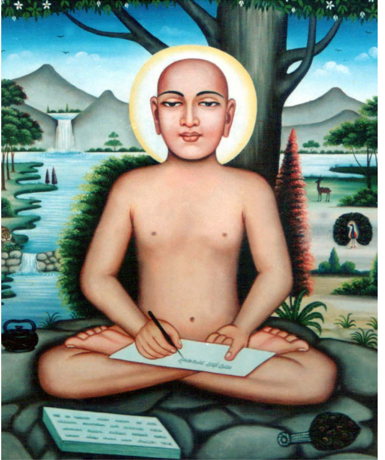
भरतक्षेत्रके महासमर्थ आचार्य श्री कुंदकुंदाचार्य देव