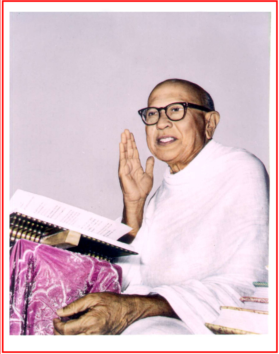
अध्यात्मयुगसर्जक पूज्य गुरुदेवश्री कानज्जस्वामी