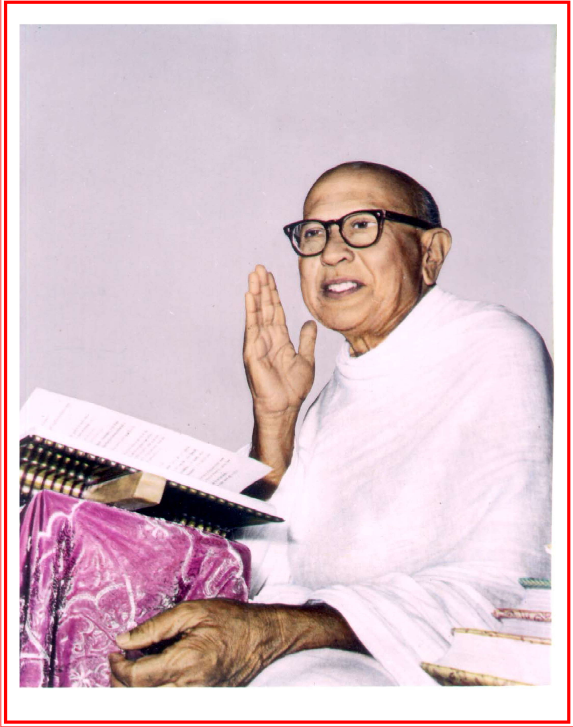
અધ્યાત્મયુગસર્જક પૂજ્ય ગુરુદેવશ્રી કાનજીસ્વામી