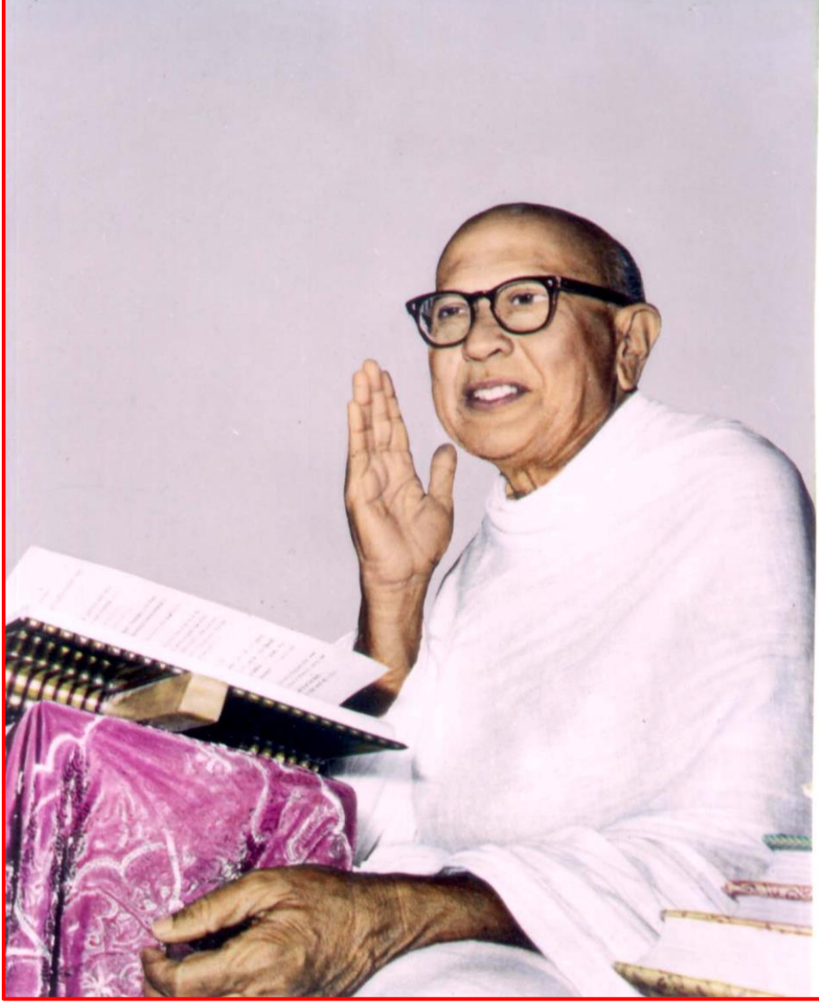
અધ્યાત્મયુગસર્જક પૂજ્ય ગુરુદેવશ્રી કાનજીસ્વામી