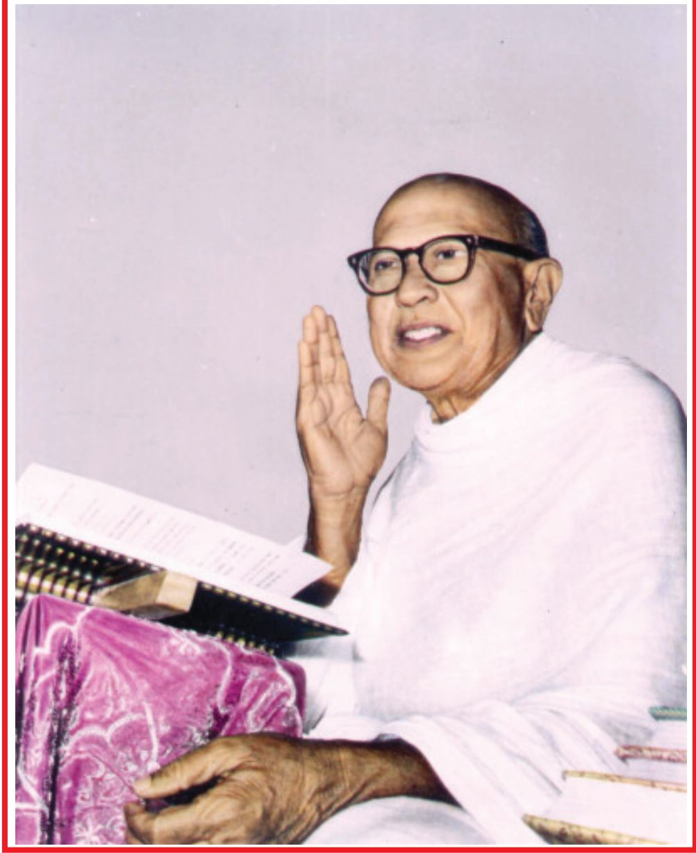
अध्यात्मयुगसर्जक पूज्य गुरुदेवश्री कानजीस्वामी