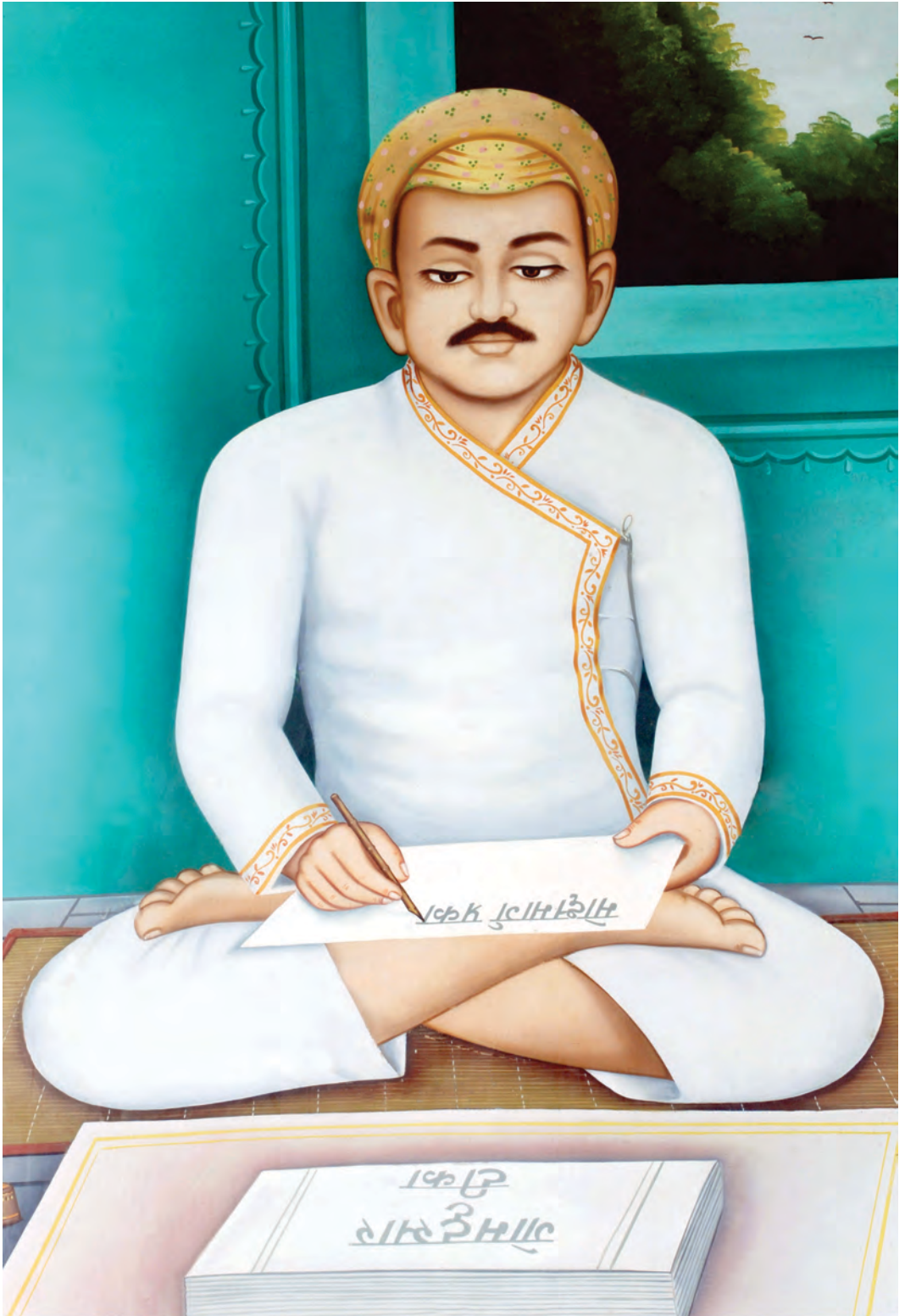
आचार्यकल्प पण्डित टोडरमल