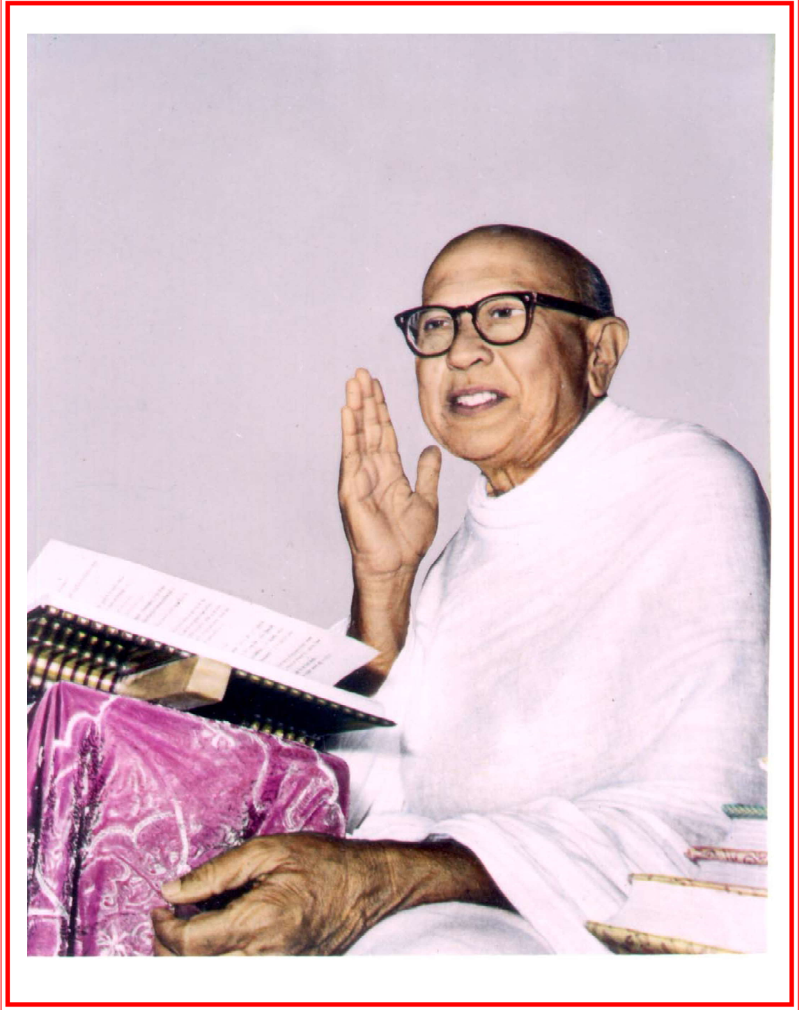
અધ્યાત્મયુગસર્જક પૂજ્ય ગુરુદેવશ્રી કાનજીસ્વામી