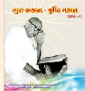
ગુરુ કદાલ - વૃદ્ધિ મહાલ